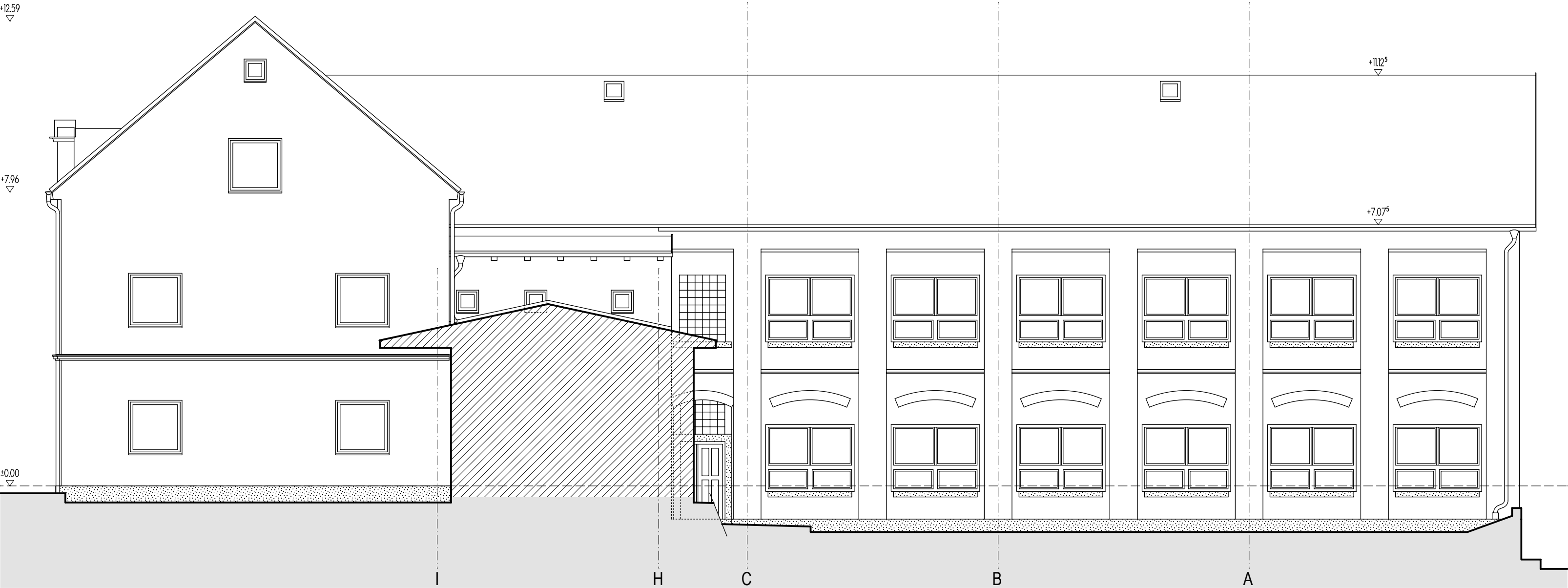
JIŽNÍ POHLED 2